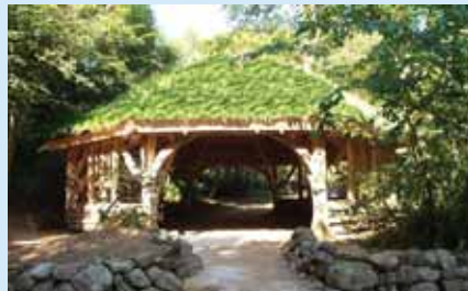
Tŷ Crwn Gwarchodfa Natur Bishop's Wood