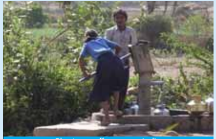
Plant ger y ffynnon yn India

Cofiwch, mae ein draeniau yn ein cysylltu ni gyda gwlypdiroedd. Mae popeth sy'n mynd lawr y draeniau'n dychwelyd i'r amgylchedd maes o law. Defnyddiwch gynnyrch yn y cartref na fydd yn niweidio'r amgylchedd ac ewch â hen olew i ddepo ailgylchu i leihau'r posibilrwydd o lygru'r dŵr.