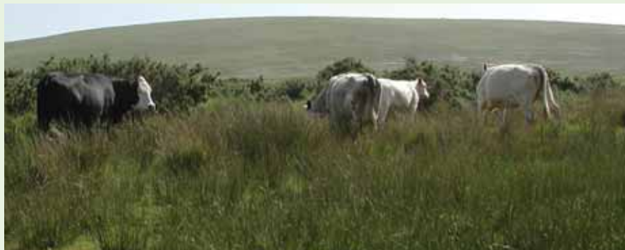
Menter Tir Comin Penrhyn Gŵyr, Cefn Bryn Gŵyr

Evch i dudalen 32 i ddysgu rhagor am wlypdiroedd.