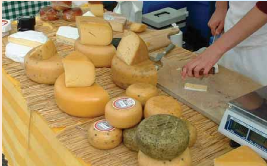
Marchnad Cynnyrch Lleol y Mwmbwls

Mae Marchnad Cynnyrch a Chrefft Penclawdd a Marchnad Cynnyrch Lleol y Mwmbwls yn gwerthu amrywiaeth o fwyd megis caws, bara, teisennau, cigoedd a llysiau. Sefydlwyd y ddwy farchnad gan Ymddiriedolaethau Datblygu Lleol, sef partneriaethau unigolion a chyrrff sy'n ceisio gwella cyflwr economaidd, cymdeithasol ac amgylcheddol yr ardal lleol er lles pawb. Darllenwch yr adran am Gymunedau i gael gwybodaeth am Ymddiriedolaeth Datblygu Lleol y Mwmbwls a ble i ddod o hyd i ymddiriedolaethau eraill.