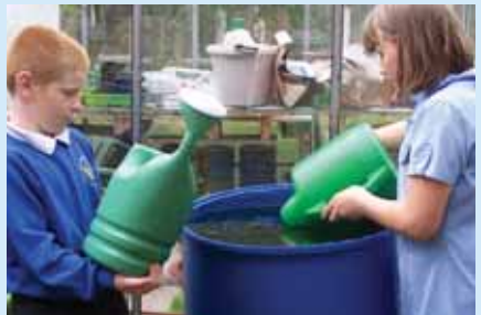
Plant yn Ysgol y Gors yn casglu dŵr o'u casgenni dŵr glaw

I gael gwybod mwy am sut i arbed dŵr, ewch i www.water-guide.org.uk