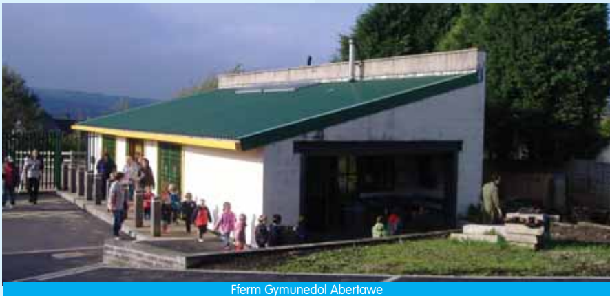
Fferm Gymunedol Abertawe

Mae Fferm Gymunedol Abertawe wedi rhoi nifer o nodweddion effeithlonrwydd ynni ar waith yn ei adeiladau. Mae llin-insiwleiddio wedi'i ddefnyddio yn nenfwd, waliau a lloriau tŷ'r anifeiliaid a'r gweithdy i atal gwres rhag cael ei gollu. Mae'r insiwleiddio hwn yn gwbl naturiol, yn hawdd i'w osod ac yn gynaliadwy o ran arian a'r amgylchedd. Mae pibellau haul yn dod â golau naturiol i dŵr anifeiliaid heb orfod defnyddio golau artiffisial ac mae ffenestri dwbl wedi'u defnyddio i atal gwres rhag dianc. Mae fframiau ffenestri a'r holl goed yn yr adeilad wedi dod o fforestydd a reolir yn gynaliadwy. Adeiladwyd y llawr â slag Margam (sgil-gynnyrch diwydiannol lleol), gan olygu bod dim angen defnyddio cymaint o ynni i'w gludo ac osgoi'r ynni ychwanegol fyddai wedi bod yn angenrheidiol i gloddio am garreg o'r newydd.