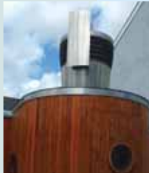
System awyru yng Nghanolfan yr Amgylchedd