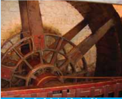
Canolfan Treftadaeth Penrhyn Gŵyr

Mae Gerddi Botaneg Singleton yn llosgi sglodion pren i gynhyrchu gwres sy'n cadw'r tai gwydr ar y tymheredd cywir.