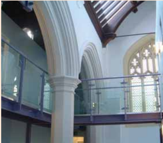
Eglwys Sant Ioan, Hafod, Abertawe

Mae Rhwydwaith y Cyffordd Moesol yn rhoi gwybodaeth am gwmnïau, cyrrff, cynnyrch a gwasanaethau sy'n foesol yn ôl asesiad, gan eich cysylltu chi â marchnadoedd moesol, amgylcheddol a chynaliadwy. www.ethicaljunction.co.uk