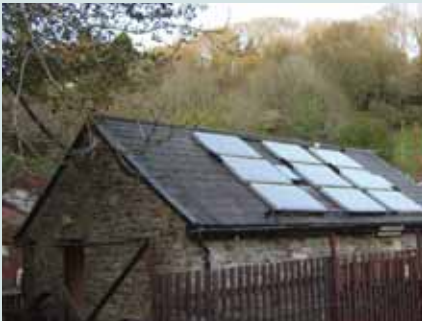
Canolfan Treftadaeth Penrhyn Gŵyr

Mae llai na 4% o'r ynni a ddefnyddir yn y DU yn dod o ffynonellau adnewyddadwy. Mae'r rhan fwyaf o'n hynni'n dod o losgi tanwydd ffosil (e.e. glo, olew a nwy) ac ynni niwclear. Serch hynny, mae tanwyddau ffosil yn ffurfio mor araf o gymharu â'r defnydd ohono, maent yn cael eu hystyried yn adnoddau cyfyngedig. Ar ben hynny, mae llosgi tanwyddau ffosil yn cynhyrchu nwyon tŷ gwydr sy'n gysylltiedig â newidiadau yn hinsawdd y ddaear. I'r gwrthwyneb, mae ynni adnewyddadwy'n cynhyrchu llai neu ddim nwyon tŷ gwydr wrth ei gynhyrchu ac mae'n ein gwneud ni'n llai dibynnol ar adnoddau na ellir eu hailgyflwyno.