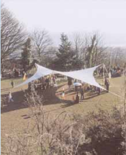
Parc Chwarel Rosehill

gan drigolion lleol yn y 1980au cynnar a oedd yn benderfynol o atal Parc Chwarel Rosehill rhag cael ei ddatblygu. Llwyddodd y grŵp penderfynol hwn i argyhoeddi Cyngor Dinas Abertawe i nodi'r ardal yn Fan Agored i'r Cyhoedd. O ganlyniad, mae'r parc yn parhau i fod yn hafan ar gyfer bywyd gwyllt ac yn wledd i'r cyhoedd yng nghanol cymaint o dai. Mae Grŵp Chwarel Rosehill yn parhau i reoli'r ardal ar gyfer difyrwch y cyhoedd a gwarchod ei bywyd gwyllt amrywiol. Mae'r parc yn fan cynnal digwyddiadau lleol erbyn hyn gan ddod â phobl y gymuned leol ynghyd. Croesewir unrhyw un lleol sydd am ddylunio a gofalu am y safle.