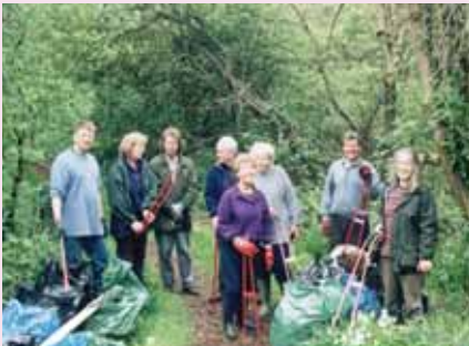
Gwirfoddolwyr Ymddiriedolaeth Datblygu'r Mwmbwls (MDT)

Dylai fod gweithredu mewn modd cynaliadwy fel unigolyn fod o fewn cyrraedd pob un ohonom, ond creu diwylliant cynaliadwy mewn cyddestun a rennir yw'r her. Mae cydweithio fel cymuned yn llawer mwy pwerus o ran cyflawni cynaladwyedd ar y blaned hon. Gall hyn fod yn deulu'n byw gynaliadwy gartref, cymryd camau gyda'ch cydweithwyr yn eich gwaith boed mewn swyddfa, ysgol neu yn yr awyr agored. Neu, gallai olygu dod ynghyd gyda'ch cymdogaeth leol mewn safleoedd neu gyfarfodydd cymunedol. Mae sawl prosiect ar y Trywydd Cynaladwyedd sy'n dangos effaith gadarnhaol cydweithio.