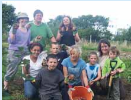
Fferm Gymunedol Abertawe

Mae Fferm Gymunedol Abertawe yn 3.5 acr o ran maint ac ar dir oedd wedi'i esgeuluso gynt yn Fforest-fach. Mae'n rhoi cyfle i bobl o bob oed a gallu i ymuno â bywyd bob dydd ar fferm fach. Mae'n cynnig amrywiaeth eang o weithgareddau ar gyfer plant a phobl ifanc gan gynnwys cynlluniau chwarae, gweithgareddau ar y penwythnos a chlwb ar ôl ysgol. Ar un pryd, gall hyfforddi anifeiliaid, sesiynau byw'n iach a chadwraeth helpu tuag at gymwysterau Prifysgol y Plant. Mae'r 'Gweision Fferm' sef prosiect arobryn y fferm ar gyfer gwirfoddolwyr, yn cynnig amrywiaeth o weithgareddau ymarferol a hyfforddiant rhan fwyaf o ddyddiau'r wythnos. Gall grwpiau ysgolion fwynhau taith 'agoriad llygad' o gwmpas anifeiliaid y fferm sydd o frîd prin neu ganfod rhyfeddod compostio ar raglen hanner diwrnod/diwrnod llawn "Trowch gyda'r Pryf Genwair".