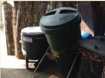
Man arddangos compost yng Nghanolfan yr Amgylchedd

Mae'r Cyngor ar fin treialu casglu gwastraff y gegin o'r un cartrefi. Os yw'n llwyddiannus, mae'n bosib y caiff ei gyflwyno ledled Abertawe.