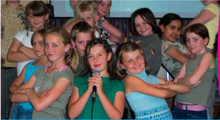
Ysgol Gynradd y Gors