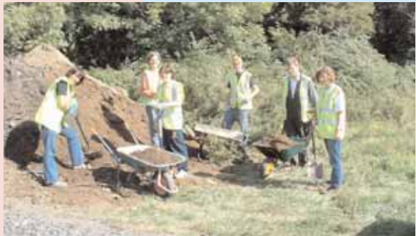
Gwirfoddolwyr a staff Sustrans yn gweithio ar y Rhwydwaith Beicio Cenedlaethol ar obryn ym Mhenclawdd

Darllenwch yr adran am Fwyd a Siopa hefyd i ddsygu sut gallwch chi leihau'r ynni a ddefnyddir i gludo nwyddau.