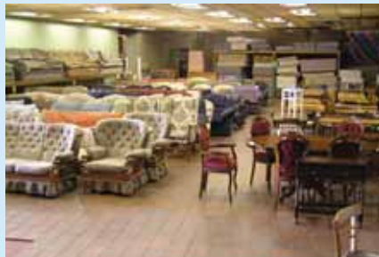
Sturdy dodrefn RESaREC

Ailosod ac ailgylchu yw ystyr RESaREC . Mae'r prosiect hwn, dan ofal Cyrenians Cymru, yn casglu dodrefn a roddwyd iddynt ac yn eu rhoi i bobl ddigartref a phobl sy'n derbyn budd-daliadau neu ar incwm isel. Mae'r prosiect hefyd yn cynnwys cynllun ail-baentio a gweithdy lle gall gwirfoddolwyr adnewyddu dodrefn wrth ddysgu sgiliau gwaith coed a chrefft. Mae'r cynllun yn cynnal siop 'Celfi Gallery and Gift Shop' (20 Stryd Mansel) sy'n gwerthu dodrefn a chrefftau gwaith llaw a wnaethpwyd â deunyddiau a ailgylchwyd.