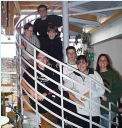
Canolfan yr Amgylchedd

Ffoniwch staff Abertawe Gynliadwy (01792 480200) i gael rhagor o wybodaeth am ymweld â safleoedd ar y trywydd.