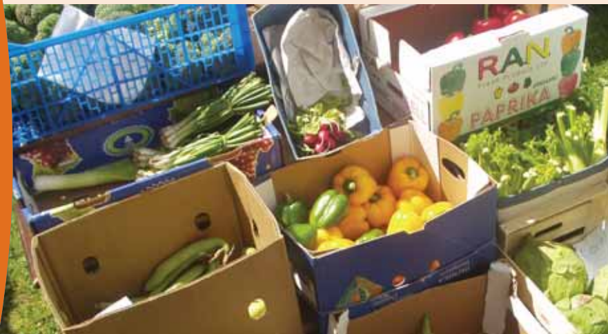
Marchnad Cynnyrch a Chrefftiau Penclawdd

Mae masnachwyr yn gwerthu cynnyrch lleol ym Marchnad Dan Do Abertawe hefyd. Mae cefnogi'r masnachwyr bychain yma yn cynorthwyo'r economi leol ac yn cynnal rhan fywiog o drefnadaeth Abertawe.