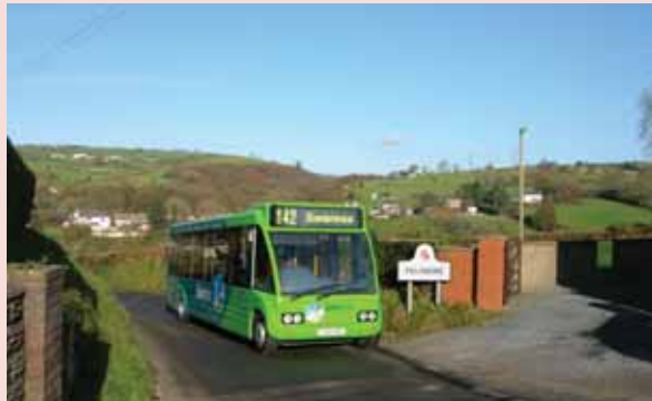
Teithwch o gwmpas Abertawe ar fws

Ar y bws! - Gall fod yn llai o straen na gyrru... dim angen poeni am barcio a chewch amser i ddarllen ar y bws. Cysylltwch â Traveline i gael amserau a gwybodaeth am fysus. Ffoniwch 0870 608 2 608 neu ewch i www.traveline-cymru.org.uk