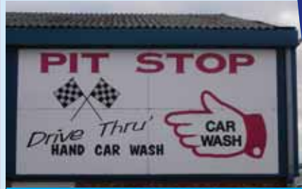
Gwasanaeth golchi ceir Pit Stop

Mae'r fim cyfeillgar sy'n golchi'r ceir yn croesawu'r cwsmeriaid ac mae'n enwog am eu manylder a'u chyffyrddiadau olaf. Ond mae llawer mwy i'r gwasanaeth na hynny'n unig.